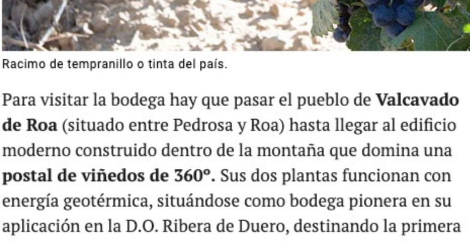
Racimo de tempranillo o tinta del país.

Tras el nombre de Traslascuestas se esconde el grupo Piérola, oriundo de la D.O. Rioja, por lo que los vinos de esta bodega nacida en el año 2009 cuentan con una personalidad propia. El toque riojano sigue presente en sus largos descansos en barrica .