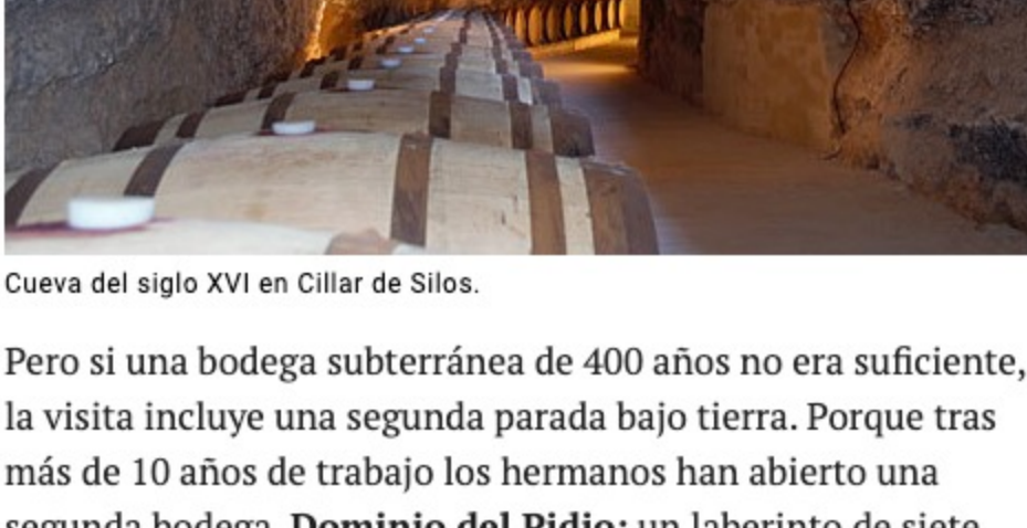
Cueva del siglo XVI en Cillar de Silos.

Los dos lagares que forman parte del patrimonio familiar cuentan con un tesoro bajo sus pies: una viga centenaria donde se prensa la uva para después descender por las escaleras hasta una cueva del siglo XVI reformada, a 30 metros bajo el suelo.