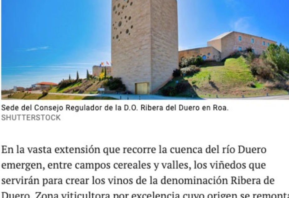
Sede del Consejo Regulador de la D.O. Ribera del Duero en Roa.

Tres centenares de bodegas forman la D.O. Ribera de Duero. Y aunque Peñafiel ostente grandes nombres como Arzuaga o Protos, Aranda de Duero y sus alrededores son otro gran epicentro bodeguero que cuenta con rincones quizá más desconocidos pero de gran belleza y largo recorrido.