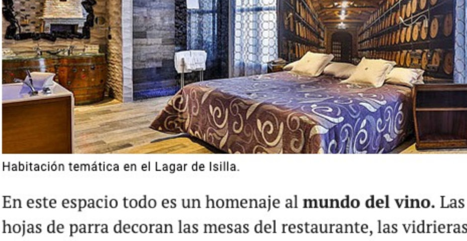
Habitación temática en el Lagar de Isilla.

La relación de esta familia con los vinos comenzó en 1995, cuando abrieron un restaurante con bodega del siglo XV en el centro de Aranda de Duero , donde producían sus primeras botellas. El aumento de la demanda les llevó a buscar un segundo espacio donde seguir produciendo, y es en La Vid, famoso por su Monasterio y a apenas 20 kilómetros de Aranda de Duero, donde erigieron una bodega moderna con hotel (21 habitaciones temáticas), restaurante y tienda.