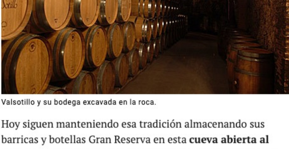
Valsotillo y su bodega excavada en la roca.

Un viaje al pasado y a la tradición viticultora espera en la bodega del siglo XVI de la familia Arroyo. Son ellos mismos los que se encargan de adentrar al visitante por los 1.200 m2 de galerías subterráneas excavadas en roca. Situada en la pequeña localidad de Sotillo de la Ribera, al sur de Roa, la familia Arroyo ha formado parte del oficio desde hace más de 400 años, aunque no comercializarían sus propios vinos hasta 1979 bajo el nombre de ValSotillo .