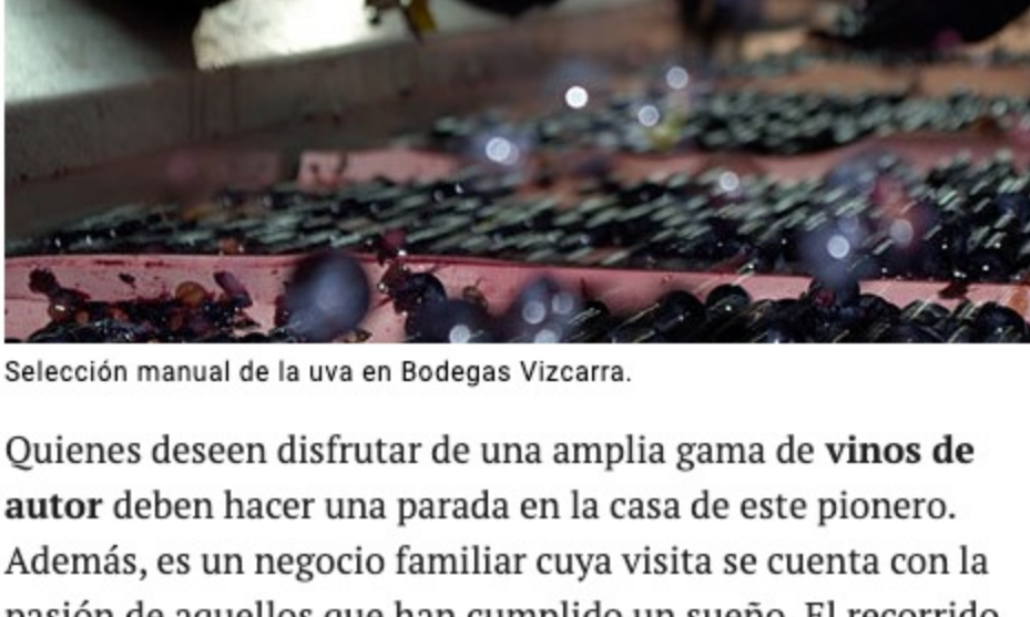
Selección manual de la uva en Bodegas Vizcarra.

La historia de Bodegas Vizcarra es la de un joven viticultor que al finalizar sus estudios de Enología recibe las viñas viejas de su padre para elaborar sus primeros vinos en el garaje de su casa. Estuvo allí 15 años y hoy sus vinos son una referencia en el campo de la innovación , los cuales nacen en una moderna edificación.